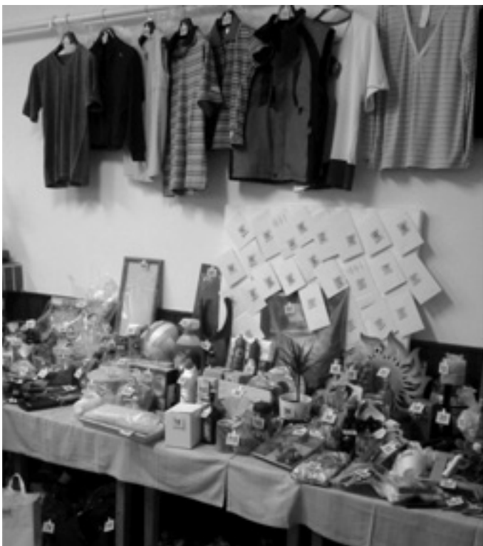
Ceny v tombole (celkem 273) na obecním plese byly velmi rozmanité.

Děkujeme Vám všem za pomoc, moc si vaší pomoci vážíme. Pracovníci farní charity Dolní Újezd