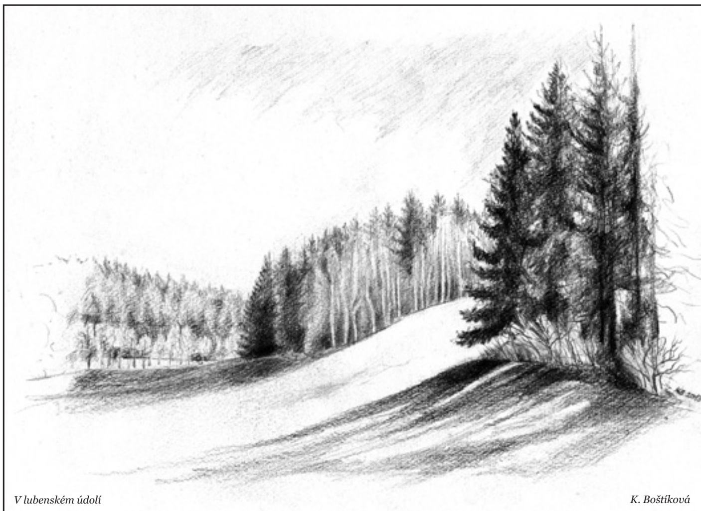
V lubenském údolí