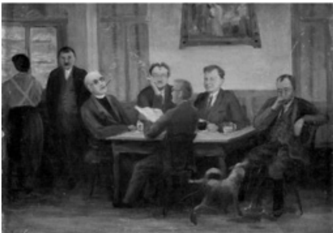
Posezení na Podhájí - 1934 - malíř sedí druhý zprava

Martin Boštík, Regionální muzeum v Litomyšli