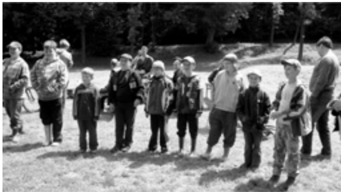
Text a foto: ing. R. Boštlík

Tradiční rybářské závody pro děti z rybářského kroužku se odehrály u rybníka za kulturním domem dne 31.5. 2014. Vítězem se tentokrát stal Vlasta Hladík z čp. 14, na druhém místě skončil Jakub Chadima z čp. 6 a třetí místo obsadil Michal Peška ze Sebranic. Všechny děti se mohly těšit na hodnotné ceny od navijáku přes různé rybářské vybavení, až po krmení pro ryby. Další ceny si děti odnesly po absolvování soutěží v rybářských disciplínách: hod prutem se zátěží na cíl a do dálky, které proběhly u rybníka po skončení závodu. Tradičně bylo pro všechny dětské účastníky i pro dospělé doprovod přichystáno pod hrází rybníka občerstvení, které následně využili i účastníci dětského dne.