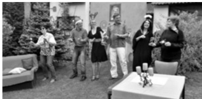
Komedie „Když se zhasne“ na Podlubníčku.