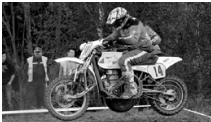
Součástí MMČR sajdkár bude závod veteránů nad 40 let na strojích vyrobených do roku 1985.