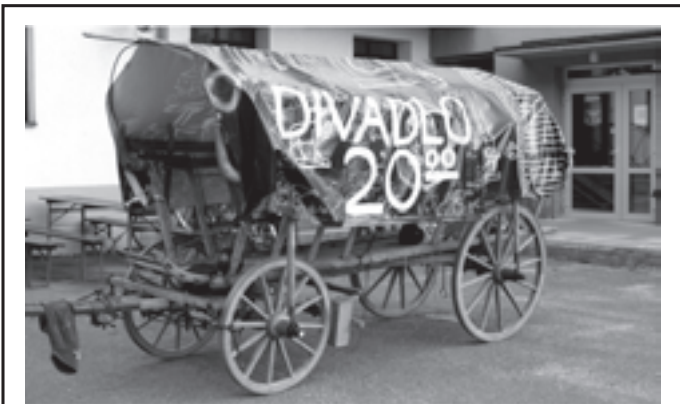
První srpnový pátek navštívilo naši obec kočovné divadlo, jednalo se o Divadelní spolek Tyl Polička, konkrétně o skupinu studentů převážně z poličského gymnázia, vysokých a středních škol, která nese název „POGYM“. Zdařilé divadelní představení Svatojánské elegie bylo netradičně a vtipně zpracované s hudebním a tanečním doprovodem. Zebříňák za pomoci pouze ručního pohonu převezl potřebné rekvizity a vybavení herců zase o vesnici dál.

Pro nejbližší období placení daně z příjmů a daně z nemovitých věcí připravuje Finanční správa i další alternativu pro platby v hotovosti, jakou byla v minulosti například tzv. „daňová složenka“, kterou bylo možné platit daně bezplatně na přepážkách České pošty s. p. Snahou Finanční správy je, aby podnikatelské subjekty platily daně primárně bezhotovostně a pro občany platící daně ze svého majetku nebo nakládáním s ním, aby se zvýšil komfort hotovostního placení.