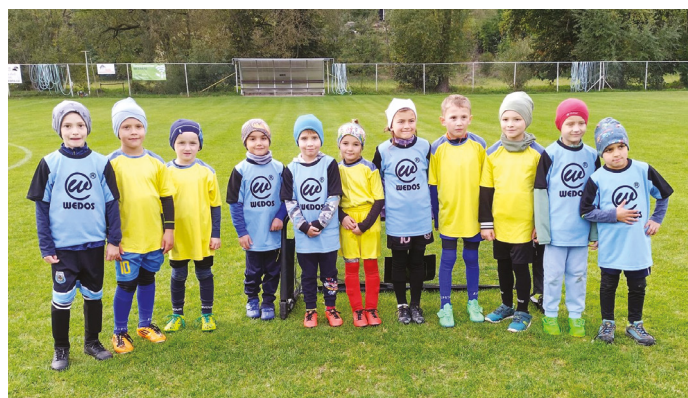
↑ turnaj předpřípravek